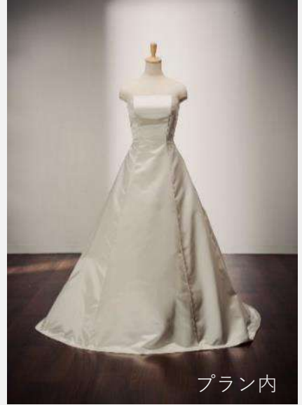
CRT-73 (PIENO-1) 本島のみ