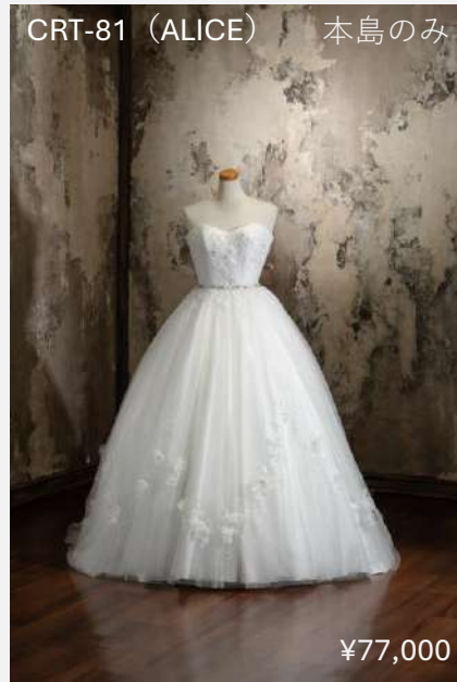
CRT-81 (ALICE) 本島のみ