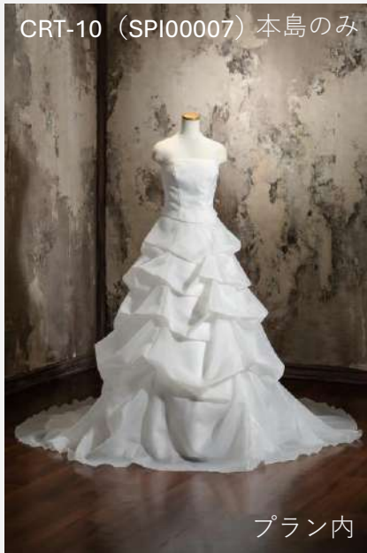
CRT-10 (SPI00007) 本島のみ