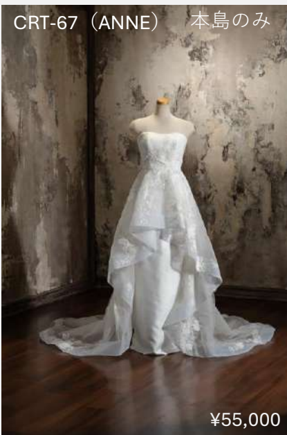
CRT-67 (ANNE) 本島のみ