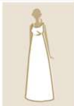
エンパイアライン