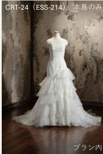
CRT-24 (ESS-214) 本島のみ