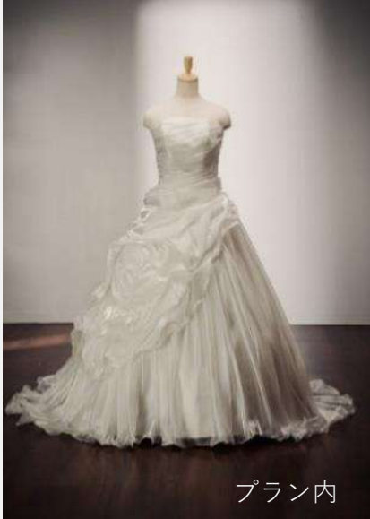
CRT-26 (PRENIO-5) 本島のみ