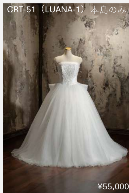
CRT-51 (LUANA-1) 本島のみ