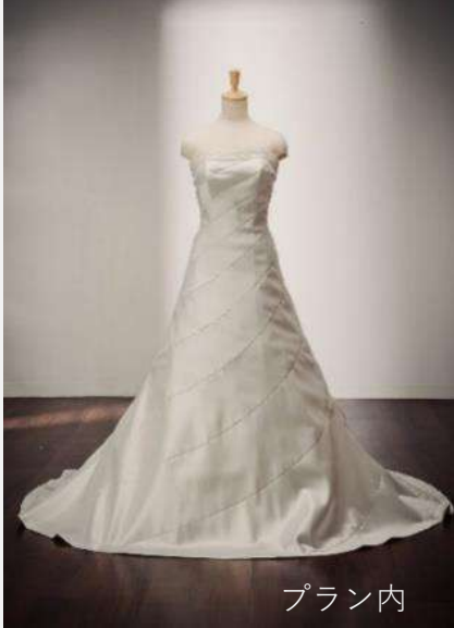
CRT-1 (PLUSME-1) 本島のみ