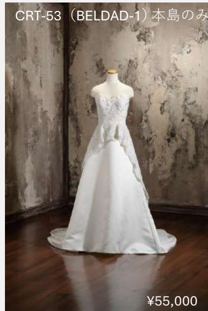
CRT-53 (BELDAD-1) 本島のみ