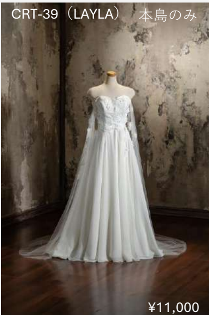
CRT-39 (LAYLA) 本島のみ