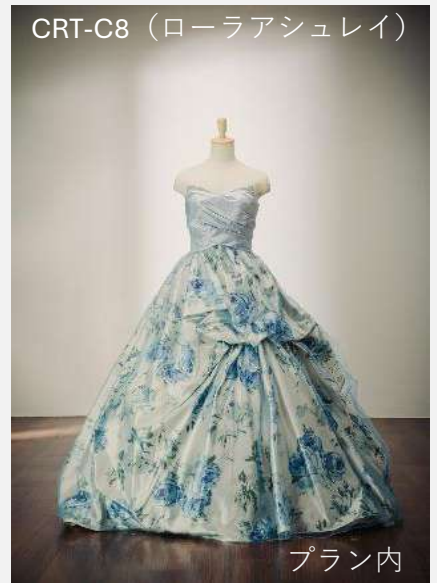
CRT-C8 (ローラアシュレイ)